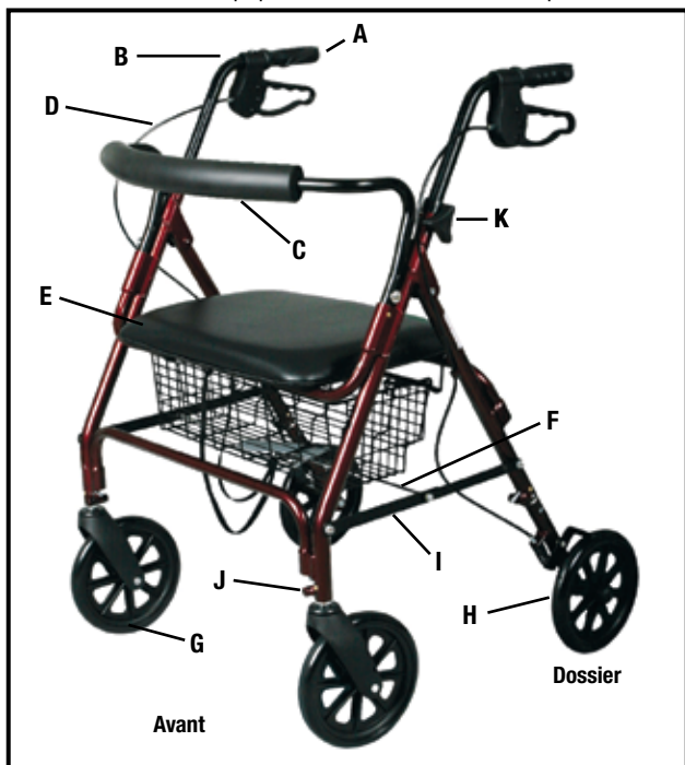
Figure 1: déambulateur à roulettes avec siège assemblé

IMPORTANT: Lisez toutes les instructions d'opération et de sécurité avant d'utiliser votre déambulateur à roulettes avec siège. Note: Vous pouvez demander une configuration et une démonstration à votre fournisseur local d'équipement médical ou votre pharmacie.