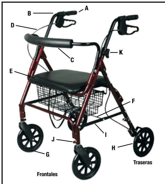
Figura 1: Rollator Ensamblado

Nota: Usted puede querer solicitar una demostración de operación con su proveedor de Equipo Médico o farmacia local.