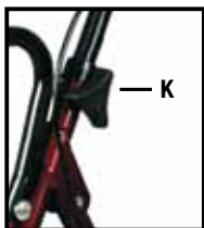
Figura 2: Tornillo de Perilla